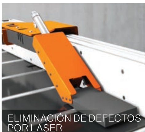
ELIMINACIÓN DE DEFECTOS POR LÁSER