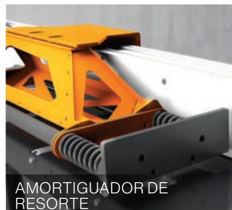
AMORTIGUADOR DE RESORTE