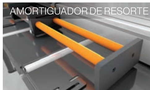
AMORTIGUADOR DE RESORTE