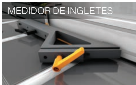
MEDIDOR DE INGLETES