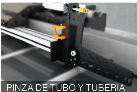
PINZA DE TUBO Y TUBERÍA