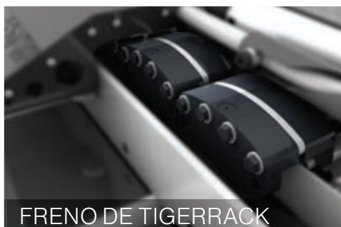
FRENO DE TIGERRACK