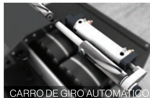
CARRO DE GIRO AUTOMÁTICO