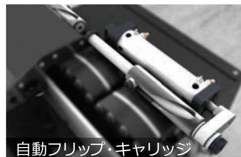
自動フリップ・キャリッジ