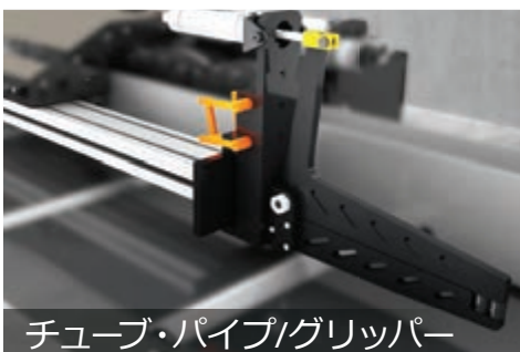
チューブ・パイプ/グリッパー